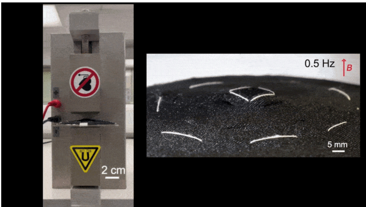
The Active Ventilation and Thermal-Regulation Fabrics can intelligently adjust air permeability by driving fibre structure deformation through electronically controlled magnetic fields.